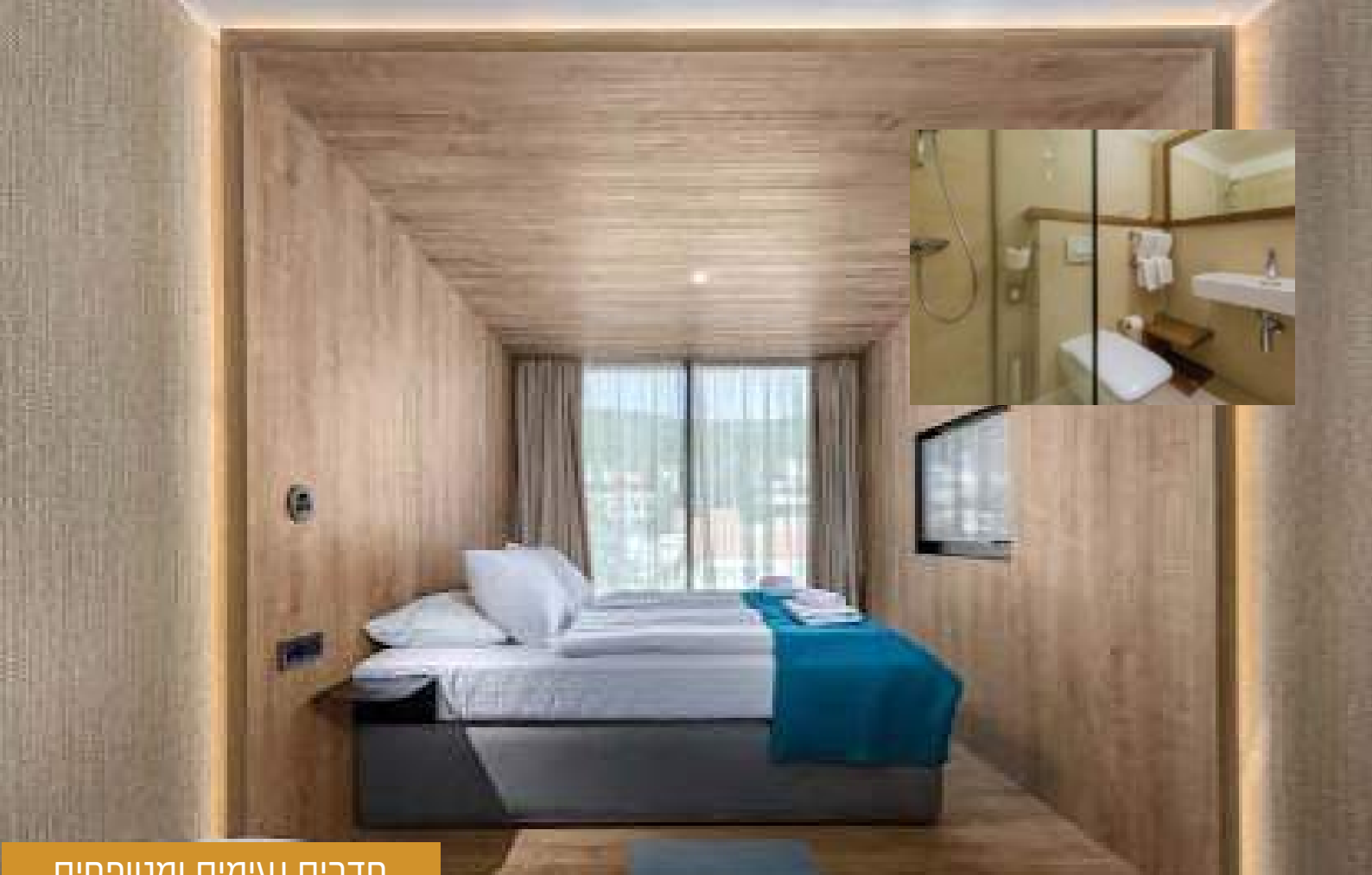
חדרים נעימים ומטופחים