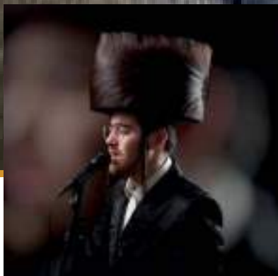
הזמר שמילי שטיינבערג

במלון יתקיימו שיעורי דף יומי קבועים, הרצאות תורניות ושיעורי תורה.